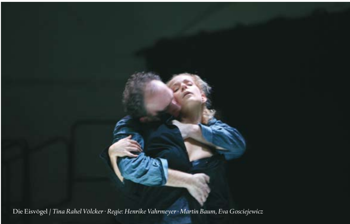
Die Eisvögel / Tina Rahel Völcker · Regie: Henrike Vahrmeyer · Martin Baum, Eva Gosciejewicz