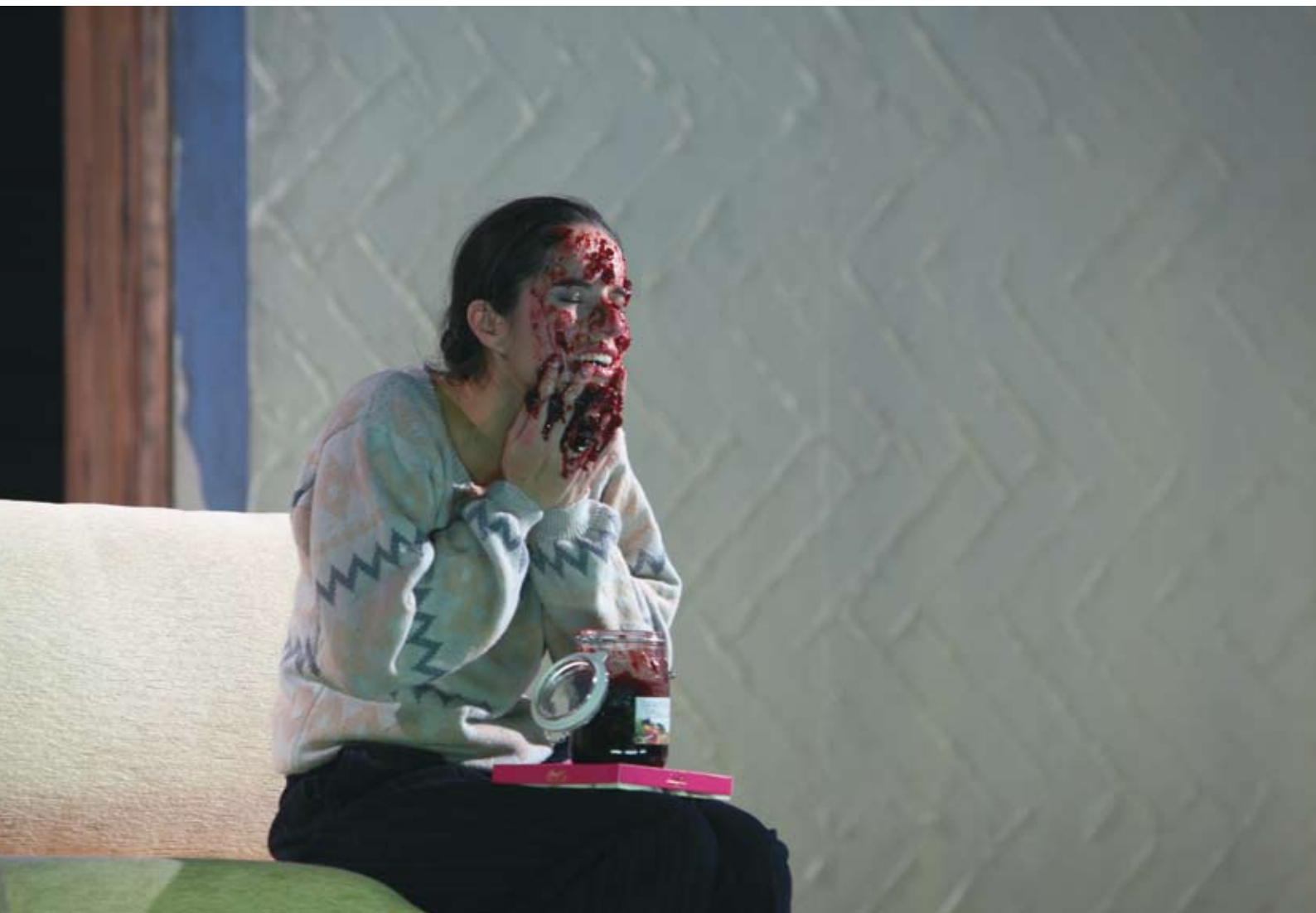
Eugen Onegin / Piotr I. Tschaikowsky · Regie: Tatjana Gürbaca · Nadine Lehner