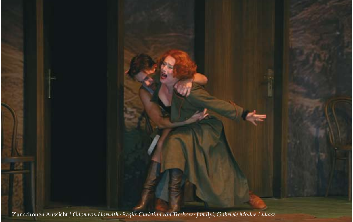
Zur schönen Aussicht | Ödön von Horváth · Regie: Christian von Treskow · Jan Byl, Gabriele Möller-Lukasz