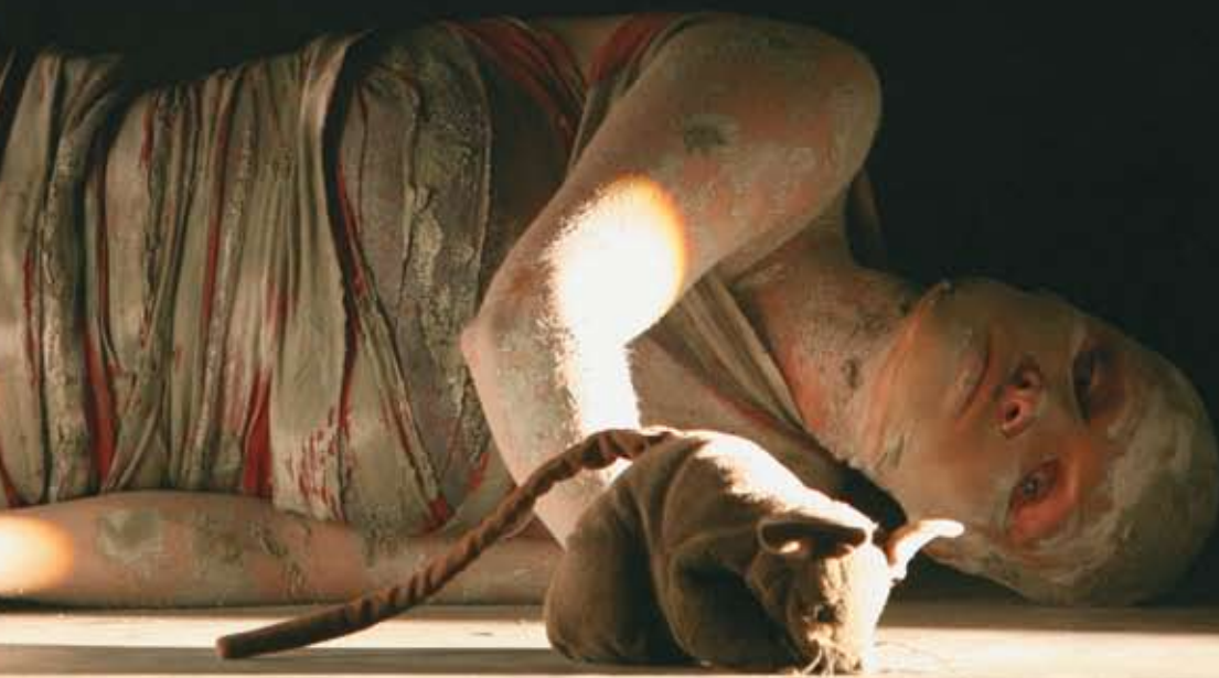
Heiner Müller Material 2 (Hamletmaschine) / Heiner Müller · Regie: Alice Buddeberg · Franziska Schubert