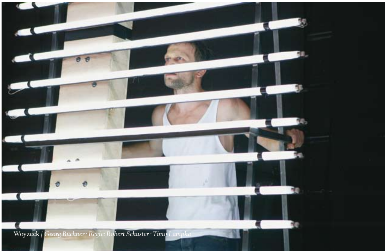
Woyzeck / Georg Büchner · Regie: Robert Schuster · Timo Lampka