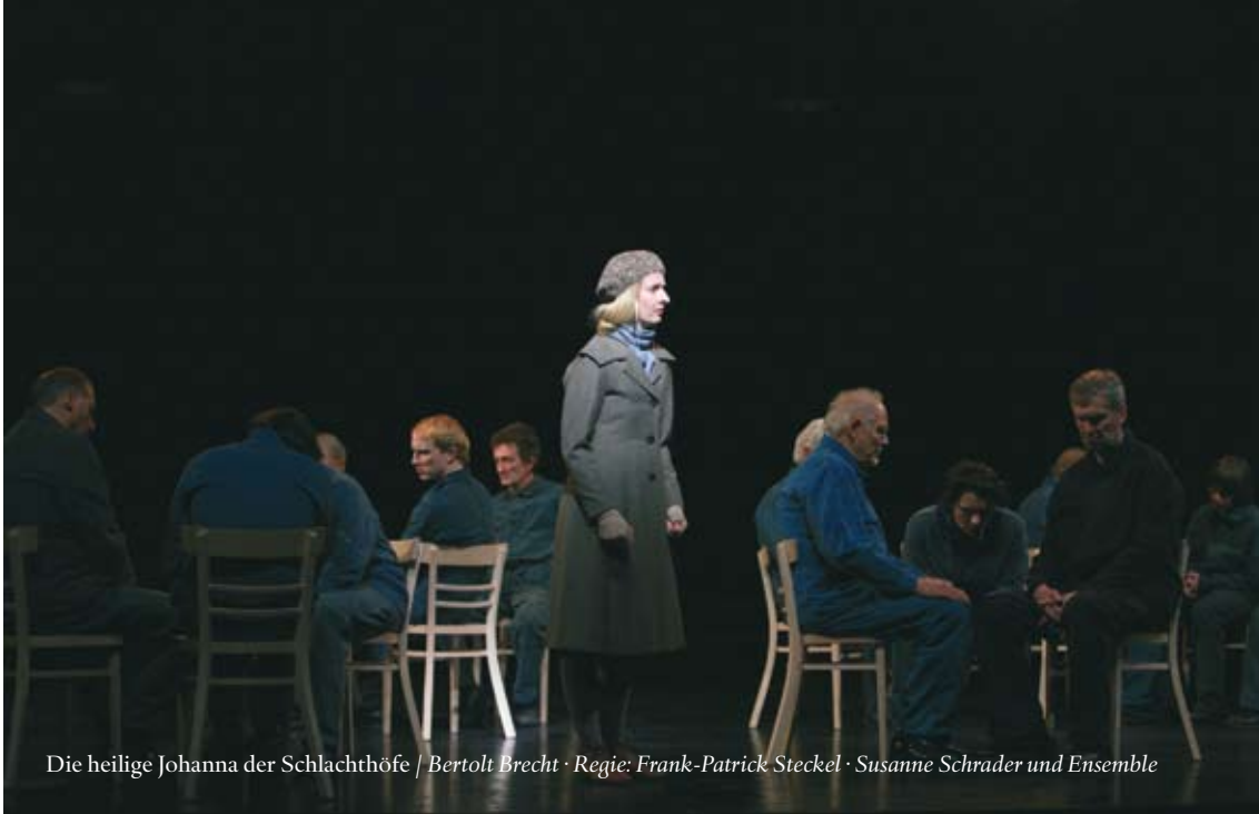
Die heilige Johanna der Schlachthöfe / Bertolt Brecht · Regie: Frank-Patrick Steckel · Susanne Schrader und Ensemble