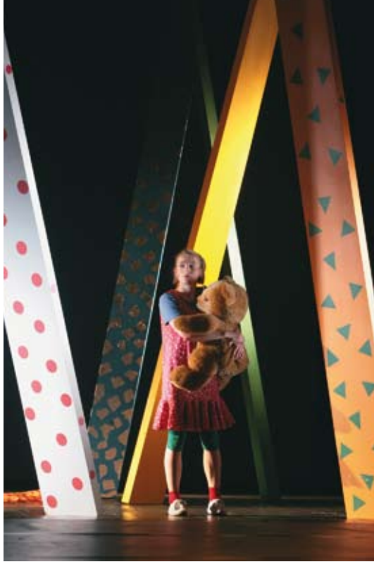
Der Zauberer von Oz / Lyman Frank Baum Regie: Dirk Böhling · Varía Linnéa Sjöström